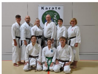
Trainerteam des TKCB e.V.